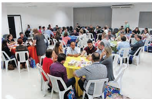
Empresários participam da 1ª Noite de Negócios da Ampe Blumenau