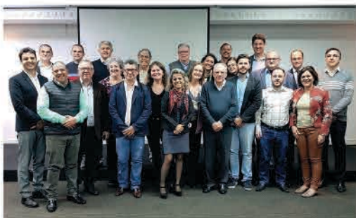
Integrantes da Diretoria da Conampe reunidos em Curitiba

ções das Micro e Pequenas Empresas e dos Empreendedores Individuais de Santa Catarina, também integrante do Sistema Conampe,